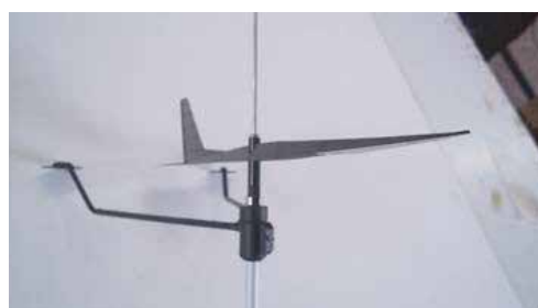
antenna with iWind mounted